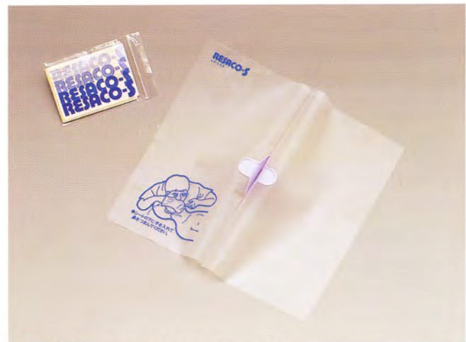
標準小売価格 230円 (税別) ×100ヶ/1ケース