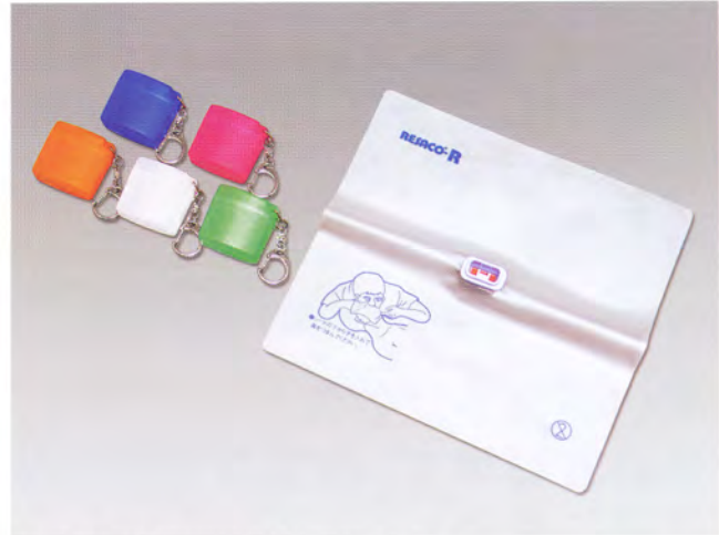
標準小売価格 680円 (税別) ×20ヶ/1ケース