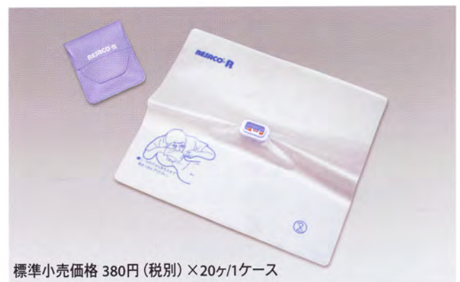
標準小売価格 380円 (税別) ×20ヶ/1ケース